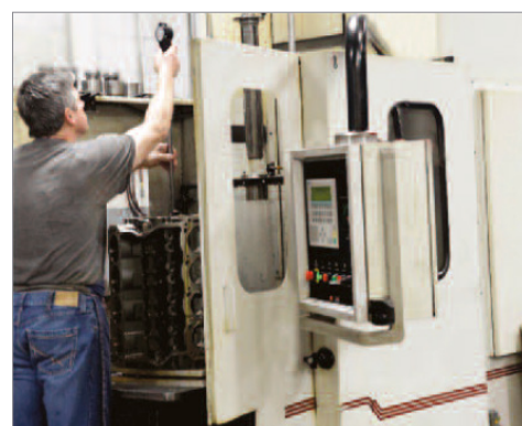
Pomiar otworów pod panewki wału korbowego wykonywany po ich uprzednim honowaniu na honownicy SV3 firmy Sunnen.

Przez ponad 30 lat firma Dart stoi na czele producentów wyczynowych silników V8. Najnowsza honownica SV-20 zapewnia najwyższą precyzję obróbki oraz wydajność produkcji i pozwala zachować firmie przewagę konkurencyjną.