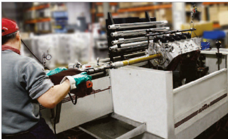
Honowanie otworów pod wałek rozrządu przy pomocy głowicy honującej RY i wykonywane na honownicy CH-100 firmy Sunnen.

Wymagana prostoliniowość osi cylindra jest zapewniona dzięki zastosowaniu w napędzie skoku honownicy serwonapędu elektrycznego z linowymi prowadnicami tocznymi, a tolerancja średnicy jest minimalna dzięki zastosowaniu w układzie rozsuwania głowicy honującej serwonapędu w pomiarze położenia. Średnice otworów, które mogą być honowane na SV20 zawierają się w przedziale: 19-380(mm). Wymiary przestrzeni obróbczej obrabiarki wynoszą: 1200 x 800 x 500 (mm), a maksymalna masa obrabianego detalu wynosi 600 kg.