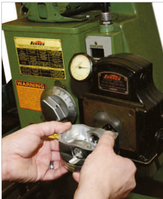
Pomiar otworu pod sworzeń tłokowy dokonywany przy użyciu przyrządu pomiarowego AG-300 firmy Sunnen po jego uprzednim honowaniu na honownicy LBB1660.

„Produkujemy części na zamówienie w dużych ilościach” – stwierdza Dick Maskin. Bloki są produkowane według indywidualnych potrzeb klienta, na które składają się: typ silnika i rodzaj materiału, rozmieszczenie cylindrów, położenie rozrządu, rodzaj sworznia tłoka, odległość od sworznia do denka tłoka, umiejscowienie popychaczy zaworowych, rodzaj śrub miski olejowej, wymiarowania w jednostkach układu metrycznego lub calowego. „Po prostu nieskończenie wiele możliwości” – twierdzi Dick Maskin. Bloki wykonywane są z wielu rodzajów żeliwa: od zwykłego szarego do wernikularnego (CGI), aluminium z zamontowanymi tulejami żeliwnymi lub też z odkuwek aluminiowych ulepszanych ciepł-