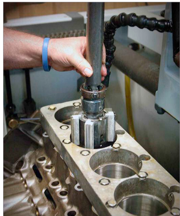
Głowica honująca Sunnen DH z osetkami diamentowymi zapewnia wielopunktowy kontakt osetek z otworem. System rozsuwania osetek z podwójnym stożkiem zapewnia jednolity docisk osetek do ściany cylindra co skutkuje wyjątkową jego okrągłością. Żywotność zestawu osetek honujących wyniosła w firmie White Performance 18 miesięcy.