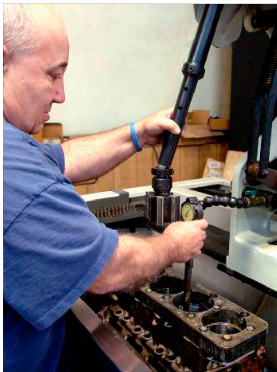
Pomiar średnicy cylindra i odchytek błędów kształtu przy pomocy średnicówki z czujnikiem zegarowym z działką elementarną 0,002mm